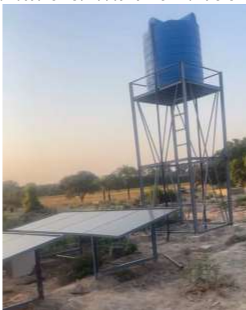
Vue d'ensemble des installations construites

Ce projet va permettre aux familles de Youtou de subvenir à leur consommation personnelle mais également de développer la vente de leurs récoltes et ainsi dégager des revenus supplémentaires pour assurer leur autonomie financière.