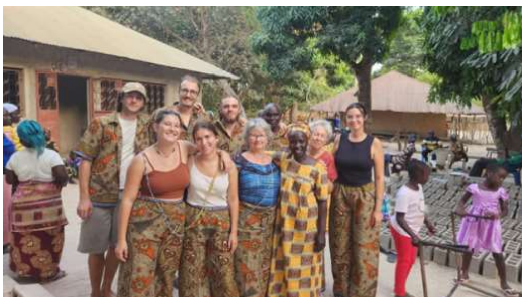
Les étudiants avec quelques habitants ou femmes dans leurs jardins

Faute d'infrastructures adaptées, les maraichères ne peuvent donc exploiter cette surface cultivable source de nourriture et de revenus.