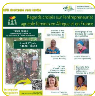
Table ronde sur l'entrepreneuriat agricole au féminin

+++ très concret, on peut apprendre un peu plus sur cette filière"; Tellement intéressant et inspirant ! J'agrandirais le créneau";