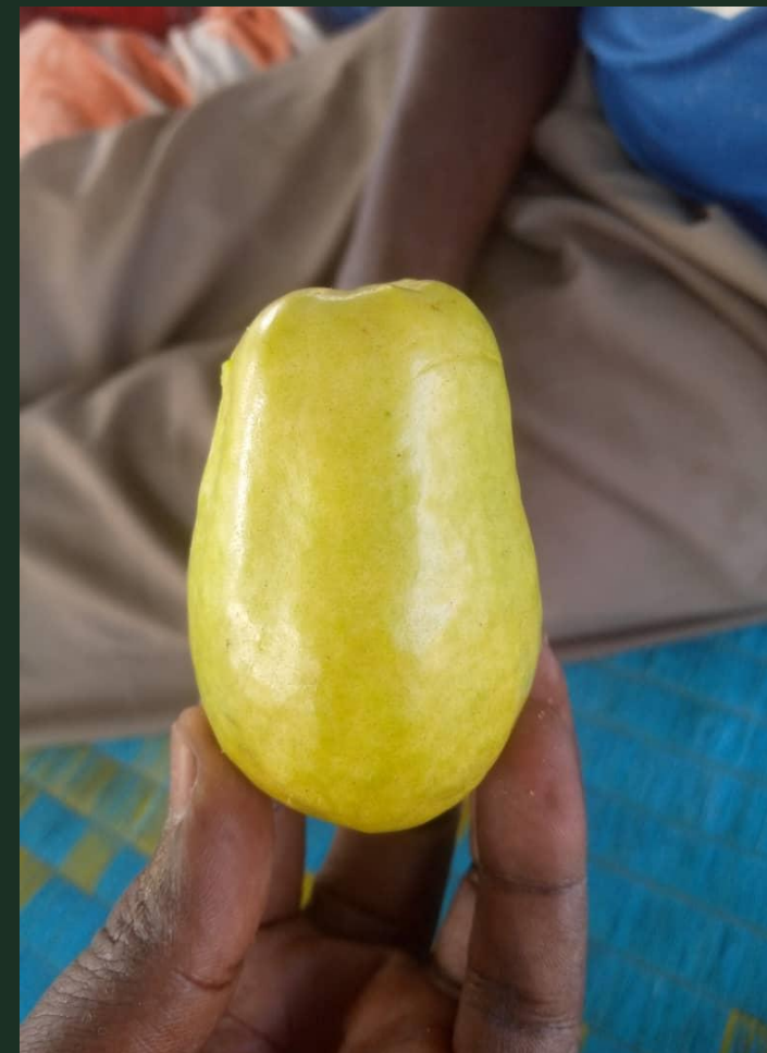
Goyavier planté en Août 2022