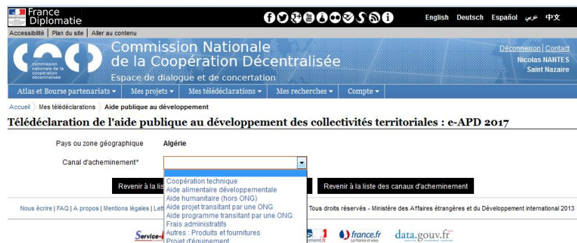
Fig. 3 : Sélectionner le canal d'acheminement par lequel transite votre APD vers ce pays (vous pouvez en sélectionner autant que nécessaire en cliquant sur le « + »).