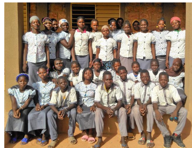
PHOTO à la rentrée 2018

Leur permettant de surmonter les difficultés liées à leur pauvreté, de s'épanouir et de s'installer près de leur famille et de pouvoir ainsi envisager leur avenir en étant autonomes.